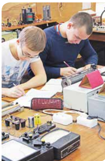
▲ Учебная лаборатория электричества и магнетизма